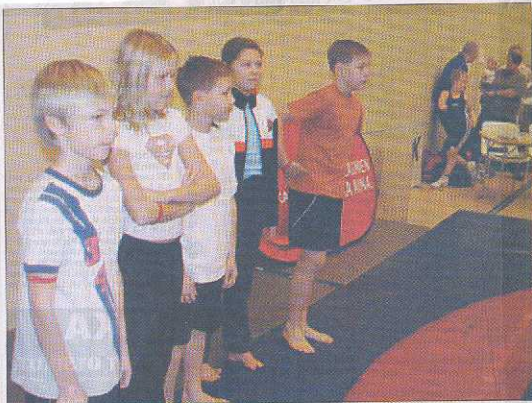
Koululaispainia Mäntsälässä. Ruukin ala-asteen oppilaat voittivat mäntsäläläiset luovutuksen jälkeen.