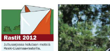
Juttusarjassa kokataan metsiä Keski-Uusimaarasteilla.